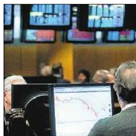
Sala de la Bolsa de Barcelona

■ Grupo Catalana Occidente abonará el 13 de octubre un dividendo a cuenta de los resultados de 2011 de 0,1101 euros por acción. La firma ganó 181,3 millones de euros en 2010, un 79,1% más que el año anterior, por el negocio tradicional y el cambio de signo en los resultados del seguro de crédito. / Efe